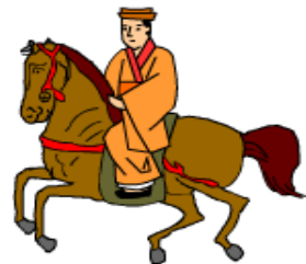
玉城朝薫 (1684~1734) 組踊の創始者

組踊は1972年沖縄が本土に復帰すると同時に、能、歌舞伎、文楽などと同じ国指定の重要無形文化財に指定されました。