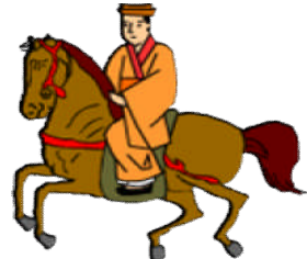
玉城朝薫 (1684～1734) 組踊を創り出した すごい人