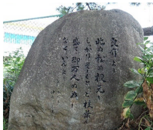
丘の一本松の碑(北谷町)