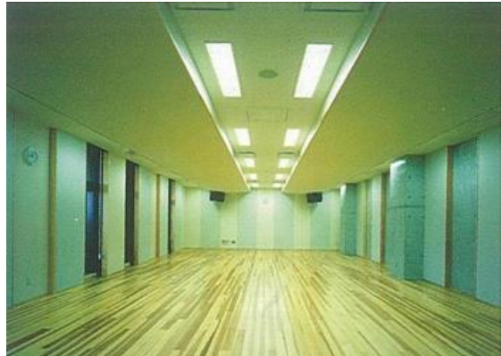
約60畳 1時間1,540円 中稽古室