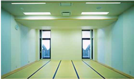
約15畳 1時間510円 第3,5,6小稽古室