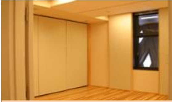
約14畳 1時間510円 第1小稽古室