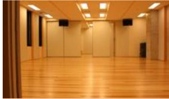
約15畳 1時間510円 第3,5,6小稽古室