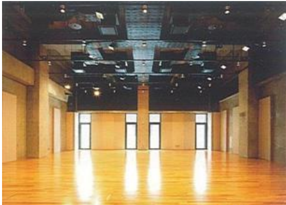
約100畳 1時間2,460円 大稽古室